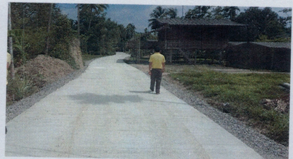
โครงการก่อสร้างและซ่อมแซมถนนในเขตเทศบาลตำบลวังไผ่