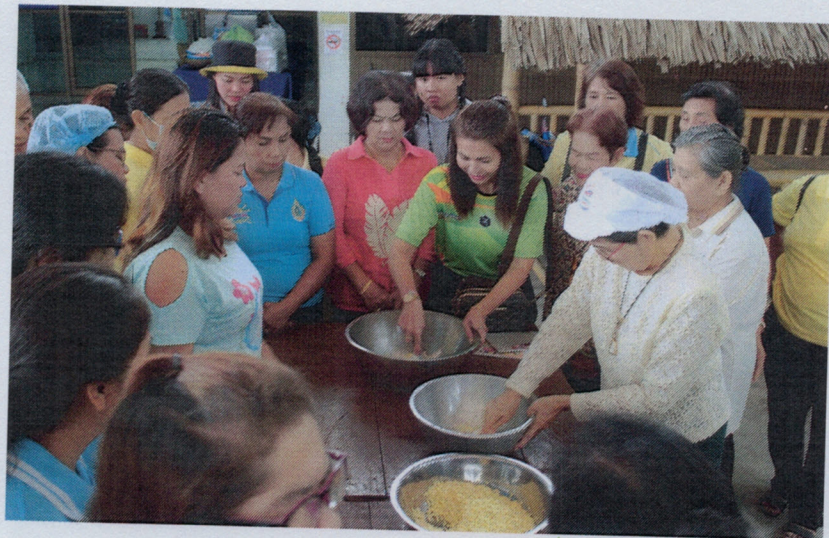
โครงการสนับสนุนศูนย์พัฒนาคุณภาพชีวิตและส่งเสริมอาชีพ (การทำขนมไทย)