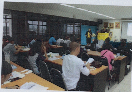
โครงการวงไฟอาหารปลอดภัย