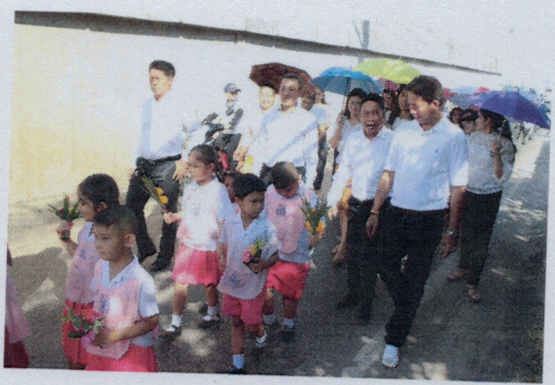
โครงการจัดกิจกรรมในวันสำคัญทางพระพุทธศาสนา