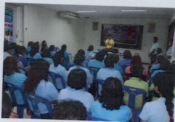
โครงการอบรมให้ความรู้และตรวจหาสารเคมีตกค้างในเลือด