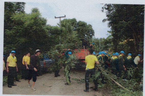
กิจกรรมบำเพ็ญสาธารณประโยชน์เนื่องในวันสำคัญต่าง ๆ