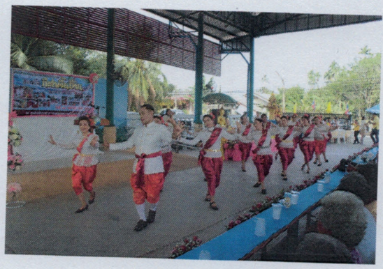
โครงการสานสัมพันธ์นันทนาการแข่งกีฬาพื้นบ้านผู้สูงอายุ