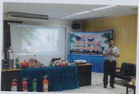
โครงการอบรมให้ความรู้การป้องกันและระงับอัคคีภัย