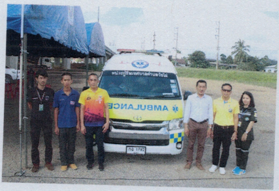
โครงการหน่วยบริการประชาชนการป้องกันและลดอุบัติเหตุทางถนน