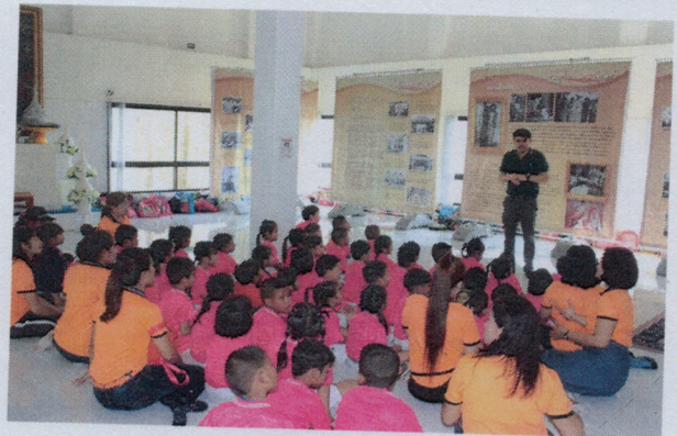
โครงการสนับสนุนการจัดกิจกรรมของศูนย์พัฒนาเด็กเล็ก