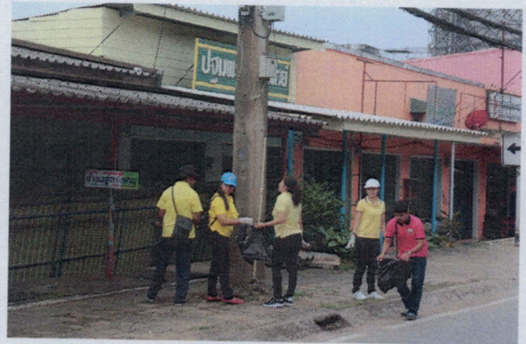
โครงการร่วมใจทำวังไผ่ให้สะอาด