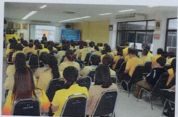
โครงการอบรมให้ความรู้เกี่ยวกับกฎหมายชีวิตประจำวันและกฎหมายท้องถิ่น