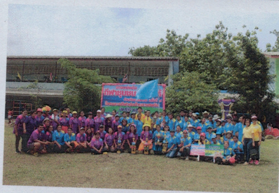
โครงการกีฬาต้านยาเสพติด